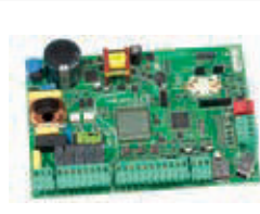
Плата управления E145 Технические характеристики на стр. 137 Артикул 790006