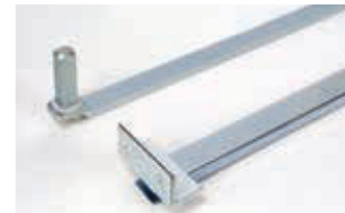
Стандартный телескопический рычаг с монтажными принадлежностями Артикул 738703