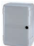
Корпус мод. LM для плат управления Артикул 720309