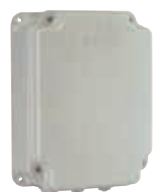
Корпус мод. E для плат управления Артикул 720119