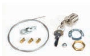
Механизм внешней разблокировки с помощью ключа, для ворот с толщиной полотна до 15 мм (с №1 по №36) Артикул 424590001-36