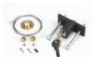
Механизм внешней разблокировки с помощью ключа, для ворот с толщиной полотна более 15 мм, с №1 по №36 Артикул 424591001-36