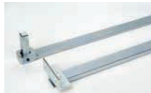
Шарнирный телескопический рычаг с монтажными принадлежностями Артикул 738700