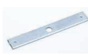
Механизм дистанционной разблокировки привода вручную Артикул 722342