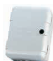
Корпус мод. L для плат управления Артикул 720118