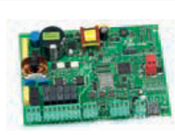
Плата управления E045 Технические характеристики на стр. 136 Артикул 790005